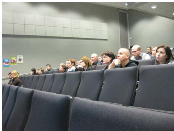
Kuusamo Lapland matkailufoorumi 17.11.2010, yleisöä